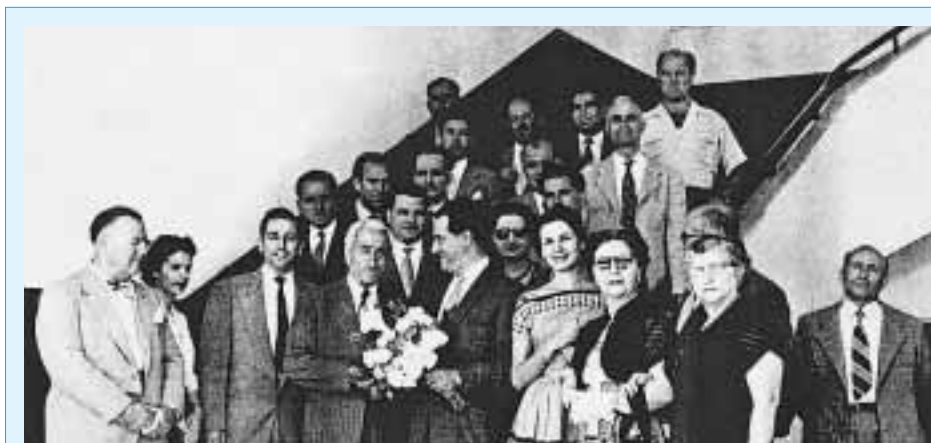
Υποδοχή-Δεξίωση στο Γυμνάσιο της Σπάρτης

Όταν φτάσαμε στην Ελλάδα, η Ελληνική Κυβέρνηση προς έκπληξη όλων είχε προετοιμάσει μία πραγματική θρυλική και φαντασμαγορική υποδοχή. Μόλις το