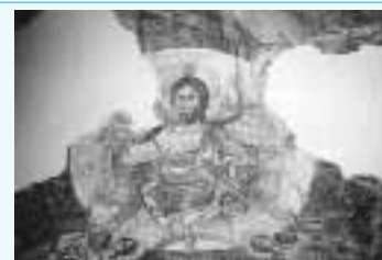
Ο Όσιος Νίκωνας σε τοιχογραφία του βυζαντινού ναού του Αγ. Νικολάου (στο χωριό Αγόριανη)

Η σεβάσμια μορφή του Οσίου Νίκωνα του «Μετανοείται» απεικονίζεται σε τοιχογραφία του βυζαντινού ναού του Αγ. Νικολάου (στο χωριό Αγόριανη), την οποία ζωγράφησε 300 περίπου χρόνια μετά τον θάνατο του Οσίου ο Κυριάκος Φραγκόπουλος.