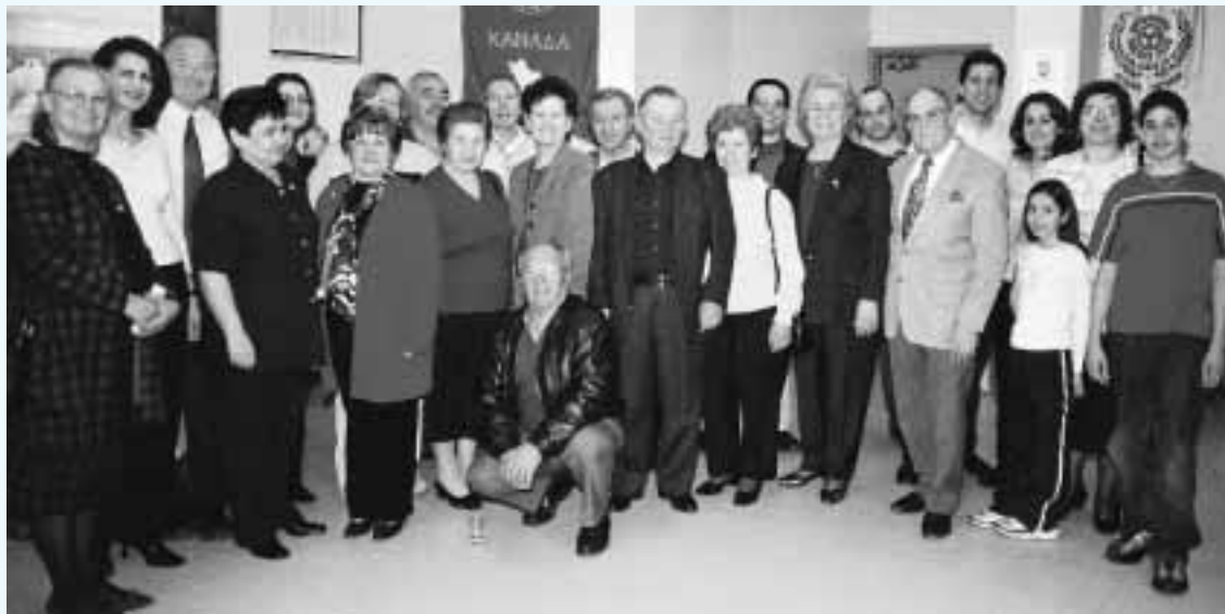
Αναμνηστικό στιγμιότυπο από τη γενική συνέλευση του Συλλόγου Λακώνων Οττάβας

Οι στόχοι του Συλλόγου Λακώνων που είναι και ο μεγαλύτερος σύλλογος στην Οττάβα, είναι η υλική και ηθική υποστήριξη της Ελληνικής Κοινότητας της Οττάβας, η αλληλοϋποστήριξη των μελών, η κατά δύναμη παροχή βοήθειας στη γενέτειρα Λακωνία, ο σύνδεσμος με τα άλλα Λακωνικά Σωματεία και η συμμετοχή και συνεργασία με την Παλλακωνική