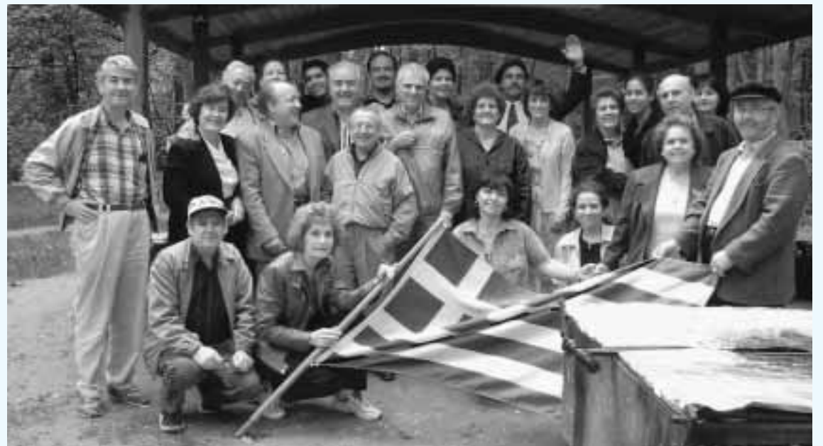
Όπως κάθε χρόνο έτσι και εφέτος την 1η Ιουνίου, ο Σύλλογός μας επραγματοποίησε την καθιερωμένη εκδρομή, πριν τις διακοπές του καλοκαιριού. Στη φωτογραφία μερικά από τα μέλη που έλαβαν μέρος.