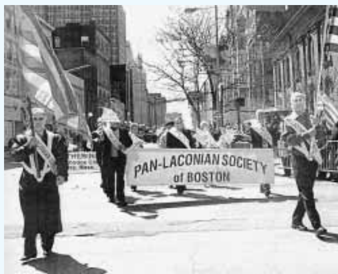
Από την παρέλαση των μελών του Συλλόγου στην επαίτειο της 25ης Μαρτίου

Πέρυσι ανάμεσα σε πολλά και διάφορα φεστιβάλ, πικνικ και χοροεσπερίδες που στέφθηκαν με επιτυχία, διοργανώσαμε και πριν λίγους μήνες μιά χορευτική βραδιά με σκοπό την είσπραξη και συνεισφορά μας προς το Γηροκομείο Σπάρτης. Πράγματι τα χρήματα αυτά εστάλησαν στο Γηροκομείο μέσω του Σεβ. Μητροπολίτη Μονεμβασίας και Σπάρτης κ. Ευσταθίου , ο οποίος και με συγκίνηση μας έστειλε ευχαριστήριο