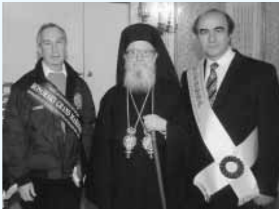
Ο Δήμαρχος Ν. Υόρκης κ. Μλούμπεργκ, ο Αρχιεπίσκοπος κ. Δημήτριος και ο Βουλευτής Λακωνίας κ. Σκανδαλάκης,

Κατά την παραμονή του, εξάλου στην Νέα Υόρκη, είχε την ευκαιρία να συναντηθεί με τον Αρχιεπίσκοπο Αμερικής κ. Δημήτριο , τον Δήμαρχο της πόλης κ. Μάικλ Μλούμπεργκ , τις ηγεσίες της ελληνικής και κυπριακής οργανωμένης ομογένειας, των επιχειρηματικών και πολιτιστικών σωματείων, εκπροσώπους των ομογενειακών ΜΜΕ, καθώς και πολλούς ομογενείς, συμπεριλαμβανομένων και των συμπατριωτών του από την Λακωνία, με τους οποίους συζήτησε θέματα που αφορούν τον Αποδήμο Ελληνισμό.