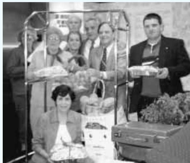
Επίσκεψη Λακώνων Σικάγου στο Greek-American Nursing Home