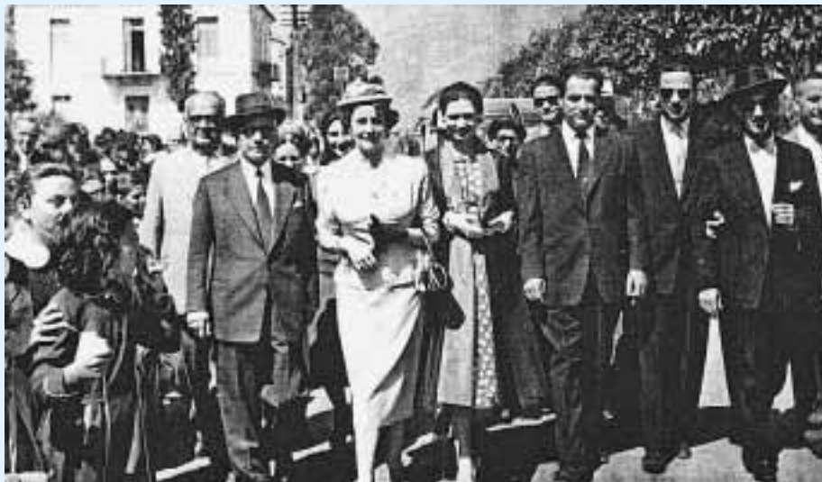
Παρέλαση στη Σπάρτη με τον Νομάρχη και Δήμαρχο