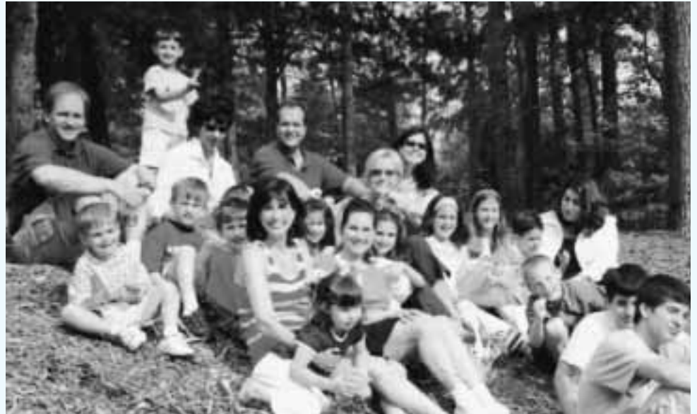
Μία ομάδα από την νέα γενιά Λακώνων, στην εκδρομή της Πρωτομαγιάς.

Η κλήρωση θα γίνει στο χορό του Συλλόγου μας 15 Νοεμβρίου 2003. Όποιος ενδιαφέρεται να τηλεφωνήσει στον αρ. 864.268.2570