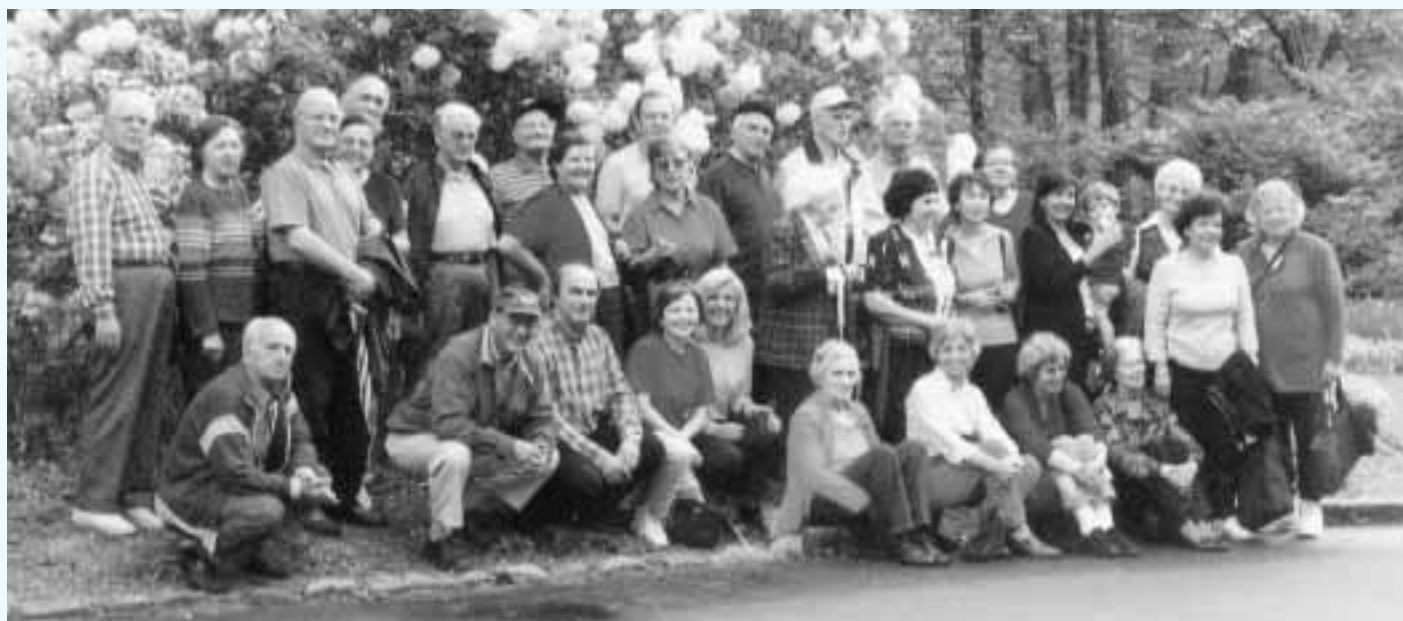
Members of our Society at the trip to Calloway Gardens, on April 5, 2003

The Laconian Society of Atlanta, GA sends greetings and love to all Laconas everywhere !!